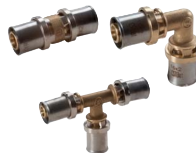
Пресс фитинги серии RM

Рабочая температура: 5÷110°C; Максимальное рабочее давление: 10 бар.