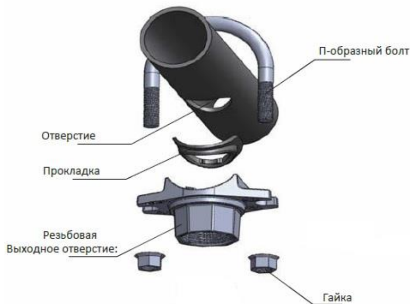
Рис.3. Гравлочное соединение отвод (седелка) резьбовой Ubolt 041.