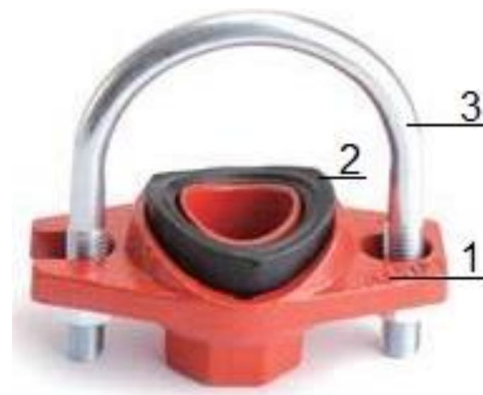
Рис.2. Отвод (седелка) Ubolt «LEDE».